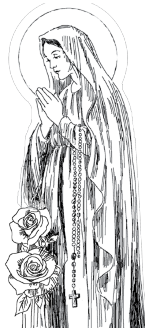
RYŚ. MALGORZATA WRONA-MORAWSKA