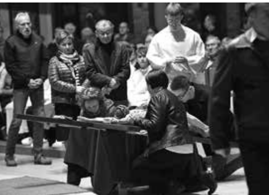
Liturgia Męki Pańskiej

– na pamiątkę gestu Jezusa wobec uczniów w wieczerniku. Podczas liturgii Wielkiego Piątku oraz Wigilii Paschalnej czytania i psalmy oraz modlitwa wiernych zostały powierzone osobom świeckim, stanowiącym już niemal zespół liturgiczny naszej