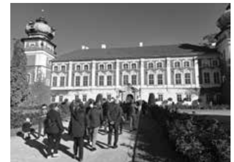
Łańcut, Zamek Lubomirskich