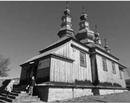
Komańcza, Cerkiew Prawosławna, u góry Komańcza, Ikonostas

górskiego jeziora skrytego pośród słynnych, zielonych, bieszczadzkich wzgórz sprawia, że miejsce to jest wyjątkowe i niepowtarzalne.