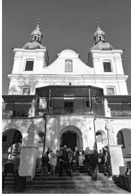
Kalwaria Pałacowska, Sanktuarium

Kolejnym etapem naszej pielgrzymki była Kalwaria Pałacowska – Kościół Znalezienia Krzyża Świętego, Sanktuarium Matki Bożej Pałacowskiej. Wizytę rozpoczęliśmy od mszy świętej sprawowanej przed ołtarzem Matki Bożej Kalwaryjskiej, którą odprawił Ksiądz Proboszcz Marcin. Następnie Ojciec Franciszkanin przybliżył nam historię słynącego łaskami, cudownego obrazu oraz kultu Matki Bożej Kalwaryjskiej. W sanktuarium tym zapoznaliśmy się również z życiem