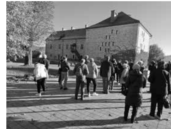
Sanok, Zamek Królewski