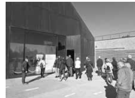
Markowa, Muzeum Polaków Ratujących Żydów podczas II wojny światowej im. Rodziny Ulmów