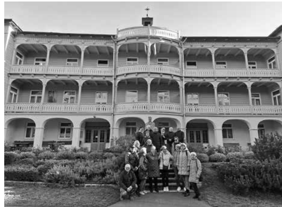
Komańcza, Klasztor Sióstr Nazaretanek

Następnym punktem naszego pielgrzymowania było Jezioro Solińskie, po którym odbyliśmy rejs statkiem. Dowiedzieliśmy się, że jest ono największym w Polsce sztucznym zbiornikiem wodnym powstałym w wyniku zalania dolin dwóch bieszczadzkich rzek – Sanu i Solinki. Niesamowita atmosfera