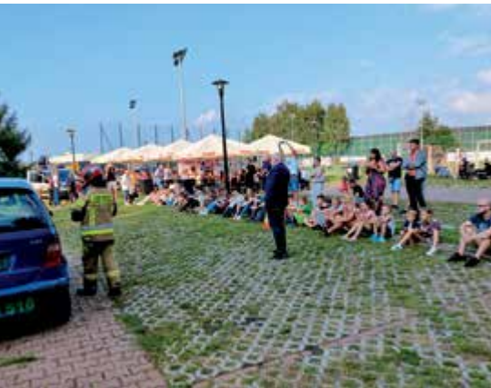
Strażacy pokazali, jak dostać się do auta, aby pomóc poszkodowanym. Zaczęło się od nauki bezpiecznego rozbijania szyb, a potem poszedł w ruch ciężki sprzęt do rozcinania karoserii