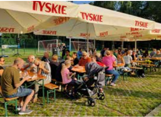
4 września dopisała pogoda i frekwencja