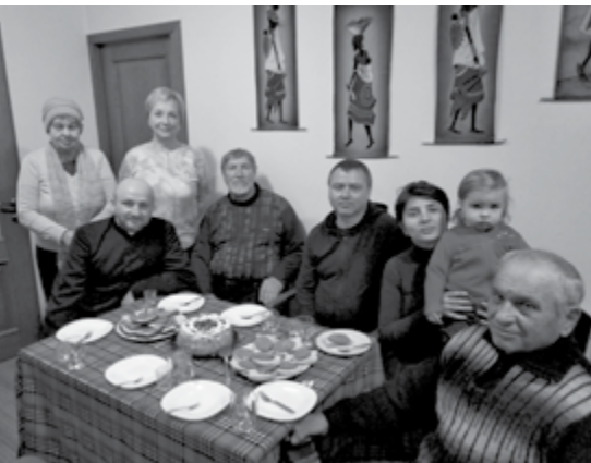
Typowa agapa po niedzielnej Mszy św.

– Zdecydowanie. Cała diecezja jest jedną, wielką wspólnotą.