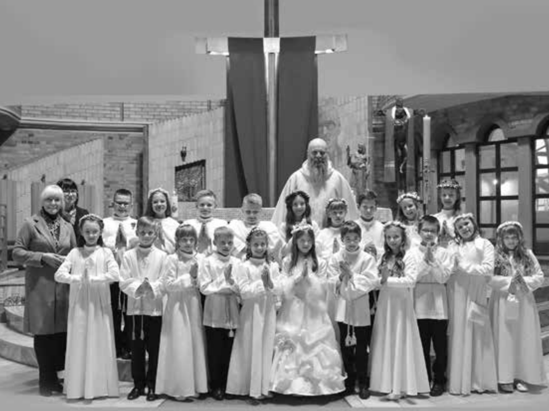
Komunia św. klasy 3a – 7 maja